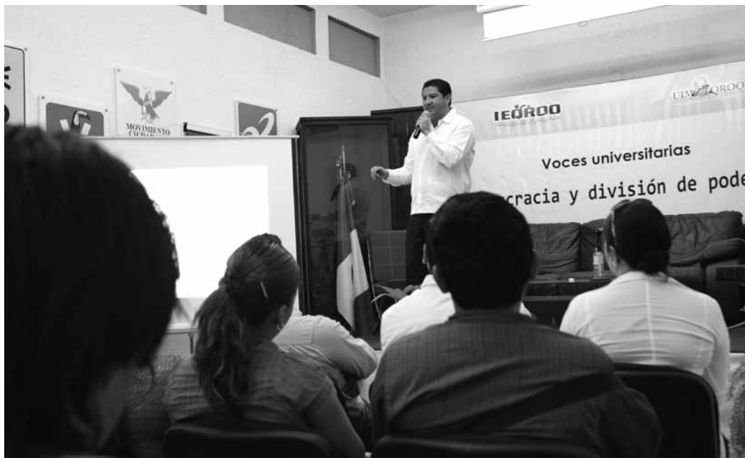
El Magistrado Presidente del TEQROO Víctor V. Vivas Vivas expone el tema "Un Voto marca la diferencia" ante estudiantes de universidades de la zona norte, en las instalaciones del Instituto Electoral de Quintana Roo.