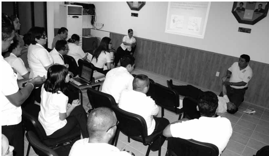
Con amplia información y ejemplos prácticos, el personal del TEQROO recibió la información introductoria a situaciones en las cuales aplicar códigos de protección civil.