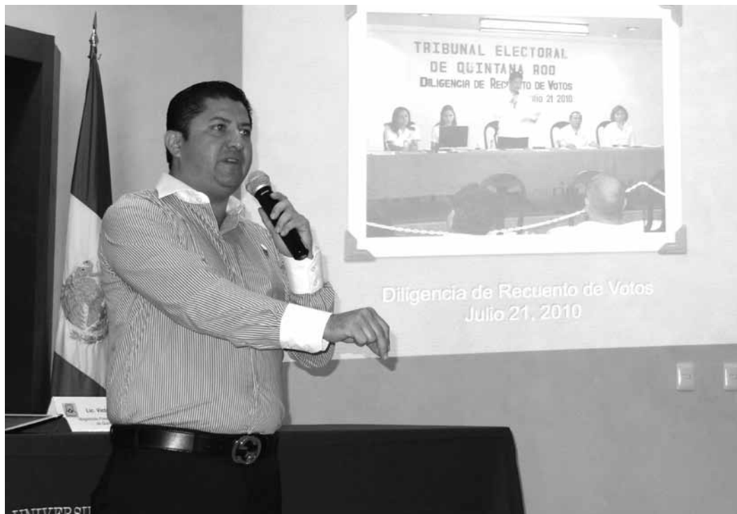
El Magistrado Víctor Venamir Vivas Vivas, expone ante autoridades universitarias de Humanitas, parte del tema "Un voto marca la diferencia", en un momento de su visita a casas de estudios superiores de la zona norte de le Estado.