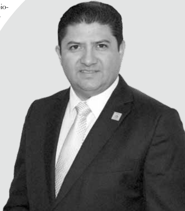
Lic. Víctor Venamir Vivas Vivas Magistrado Presidente

Acercar el Tribunal Electoral de Quintana Roo a la ciudadanía, así como incrementar la confianza de que los derechos político electorales del ciudadano quintanarroense y de los partidos políticos serán respetados, con estricto apego a la legalidad y la justicia, son objetivos primordiales de quienes conformamos hoy la 3ª Época del TEQROO, la Federación y el JDC/004/2012 el cual se reencauzó a la instancia intrapartidista para que determinara lo conducente.