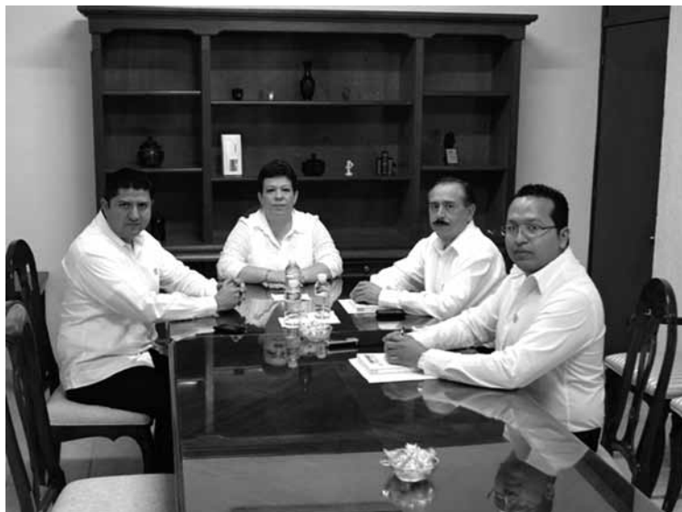
Conforme al Artículo 27 de la Ley Orgánica del Tribunal Electoral de Quintana Roo, los Magistrados integrantes del Pleno sesionaron de forma privada para elegir al Magistrado que presidirá el organismo de 2012 a 2015.