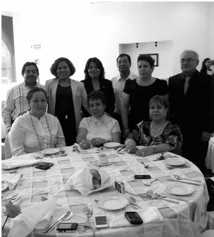
La Magistrada del TEQROO Sandra Molina Bermúdez, asistió a la "Primera Reunión de Magistrados Electorales de la Tercera Circunscripción Plurinominal", realizada el pasado 22 de febrero en la ciudad de Xalapa, capital del Estado de Veracruz.