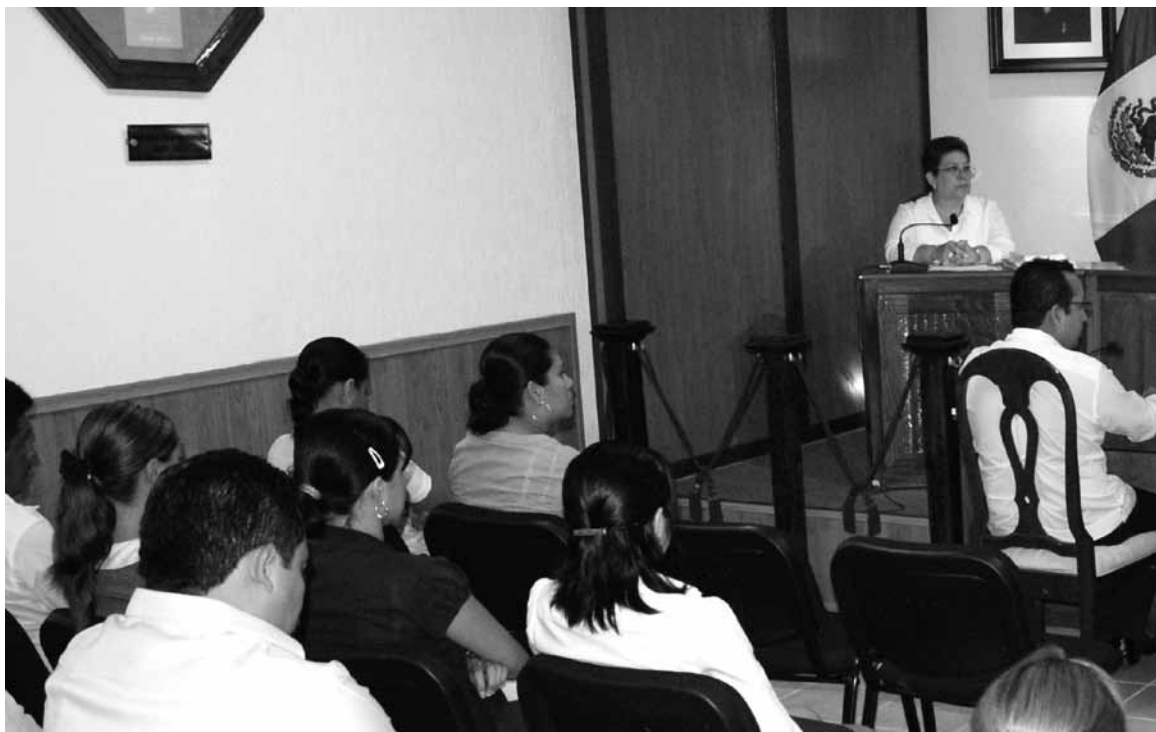
El Magistrado Presidente da lectura a los resolutivos de la ejecutoria correspondiente al JDC/004/2012.