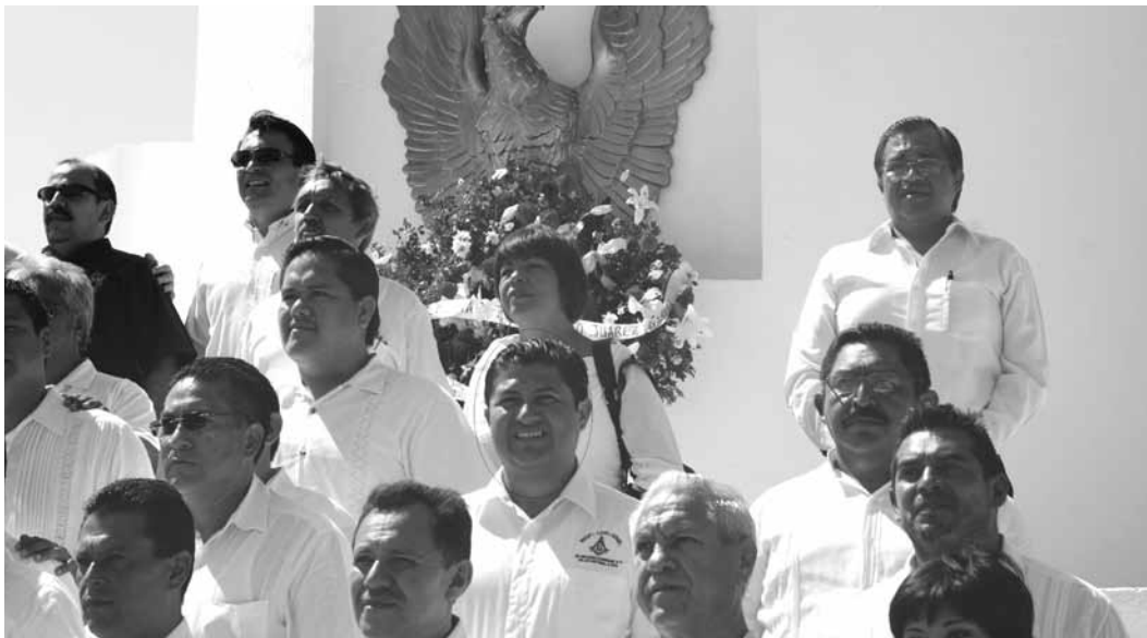
El Magistrado Viva Vivas (centro) durante la ceremonia del 206 aniversario del natalicio de Benito Juárez en el monumento a la Patria en Chetumal.