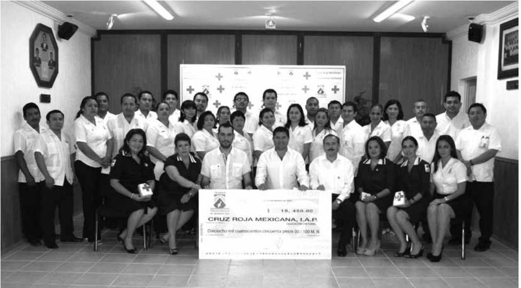
Las damas Voluntarios de la Cruz Roja, encabezadas por el Presidente de la Institución en Chetumal, recibieron de los servidores electorales del TEQROO las aportaciones, institucional y voluntarias, en apoyo y solidaridad con la benemérita institución.