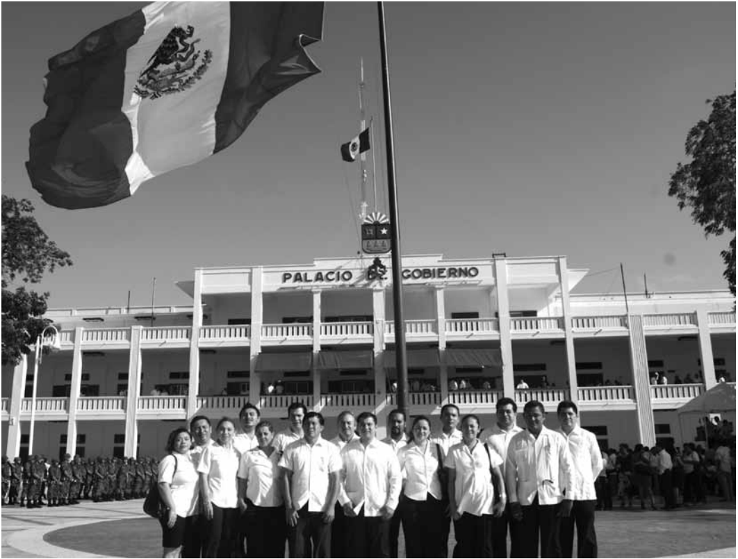
Personal del TEQROO asiste a ceremonia conmemorativa del CXCI Aniversario del Día de la Bandera, realizado en la explanada, frente a la sede del Poder Ejecutivo en Chetumal.