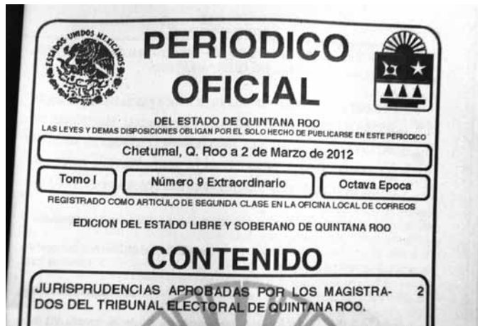
Punto 5: Aprobación de Jurisprudencia y Tesis Relevantes derivadas de las Sentencias del Tribunal.

Conforme a lo dispuesto en el Artículo 23 de la Ley Orgánica del Tribunal Electoral de Quintana Roo, se publica el contenido del punto 5 de la orden del día de la Sesión de Pleno Privada celebrada el 23 de enero de 2012, en la cual fueron aprobadas por unanimidad las tesis y jurisprudencias; Jurisprudencias que a su vez fueron publicadas en el Periódico Oficial de fecha 2 de marzo de 2012, Tomo I Número 9 Extraordinario Octava Época: