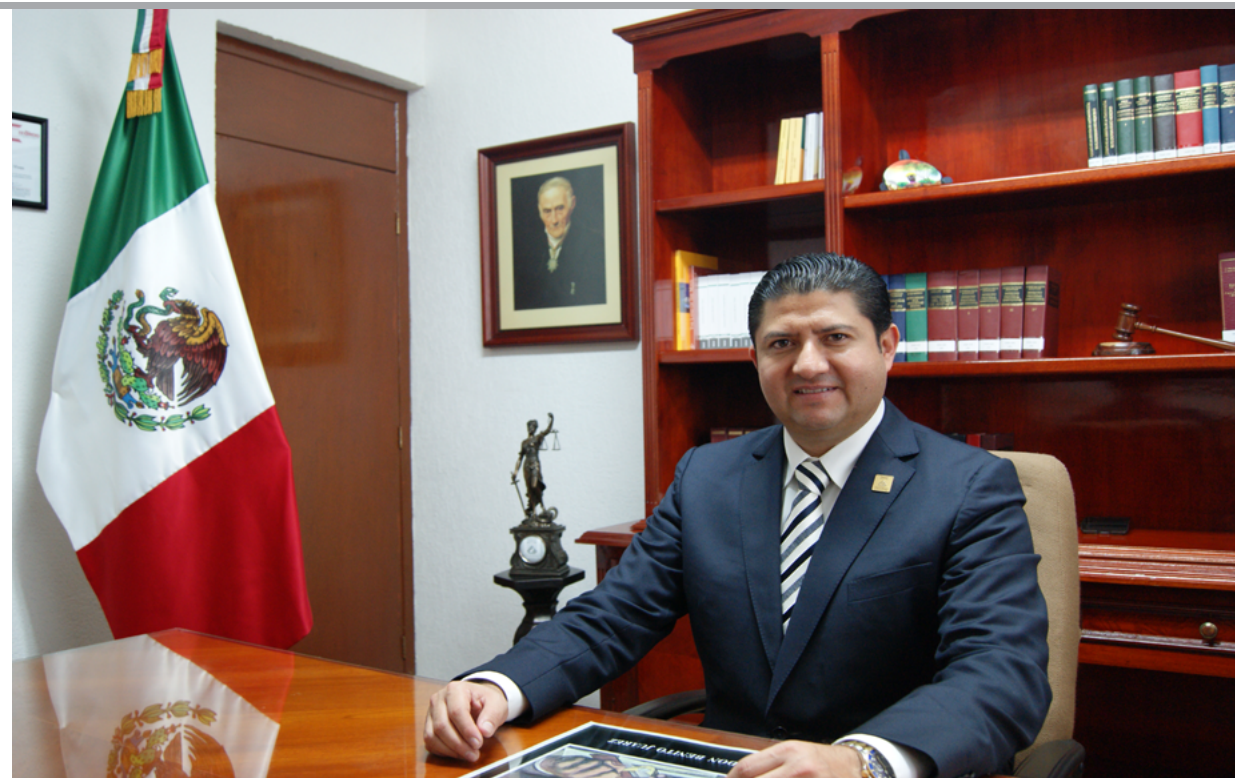
Lic. Víctor Venamir Vivas Vivas Magistrado Presidente

Por otra parte, en el apartado de jurisprudencia se destacan los rubros mas recientes. Y en nuestro espacio de biografía destacamos en esta ocasión puntos geográficos históricos: Tepich y Tihosuco, relacionados con el movimiento social indígena “Guerra de Castas”.