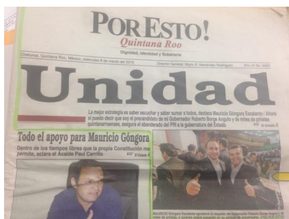
Imagen 1. Portada del Periódico “POR ESTO! QUINTANA ROO”

En su portada se observa la imagen de los ciudadanos Roberto Borge Angulo y José Mauricio Góngora Escalante, abrazados, ambos mostrando el pulgar derecho hacia arriba, y en el encabezado de la imagen se observa el texto siguiente: “Unidad” “La mejor estrategia es saber escuchar y saber sumar a todos, destaca Mauricio Góngora Escalante/Ahora sí puedo decir que soy el precandidato de mi Gobernador Roberto Borge Angulo y de miles de priistas quintanarroenses, asegura el abanderado del PRI a la gubernatura del Estado”; asimismo, en la parte inferior de dicha imagen se lee lo siguiente: “MAURICIO Góngora Escalante agradeció el respaldo del Gobernador Roberto Borge Angulo y de miles de priistas, a quienes estará sumando en su periodo de precampaña. (Foto POR ESTO!)”.