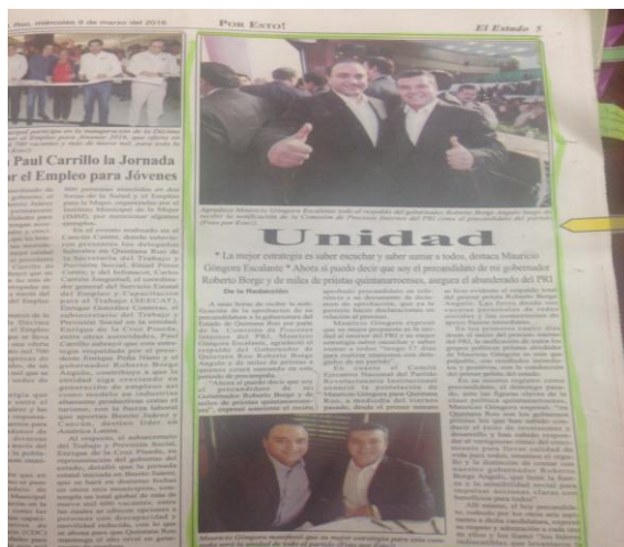
Imagen 3. De la sección El Estado, página 5 del Periódico “POR ESTO! QUINTANA ROO

Asimismo, en dicho rotativo en comento, se observa en la sección La ciudad página 1, a blanco y negro la imagen de los ciudadanos Roberto Borge Angulo y José Mauricio Góngora Escalante, abrazados, ambos mostrando el pulgar hacia arriba, y en el encabezado de la imagen se observa el texto siguiente: “La mejor estrategia es saber escuchar y saber sumar a todos, destaca Mauricio Góngora Escalante” “Unidad”. “*Ahora sí puedo decir que soy el precandidato de mi Gobernador Roberto Borge Angulo y de miles de priistas quintanarroenses, asegura el abanderado del PRI a la gubernatura del Estado”; El Estado 5 , asimismo, en la parte inferior de dicha imagen se lee lo siguiente: “Mauricio Góngora Escalante agradeció el respaldo del Gobernador Roberto Borge Angulo y de miles de priistas, a quienes estará sumando en su periodo de precampaña. (Foto POR ESTO!)”.