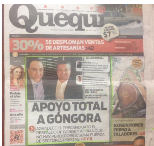
Imagen 1. Portada del Periódico “QUEQUI”