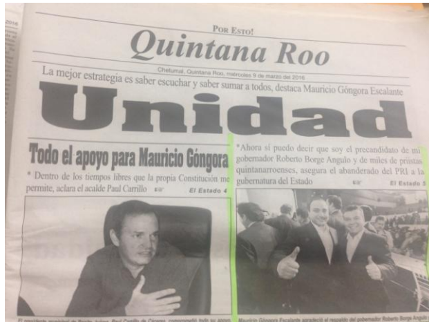
Imagen 2. Sección La ciudad, del periódico “POR ESTO! QUINTANA ROO”.

Asimismo, en dicho rotativo en comento, se observa en la sección La ciudad página 1, a blanco y negro la imagen de los ciudadanos Roberto Borge Angulo y José Mauricio Góngora Escalante, abrazados, ambos mostrando el pulgar hacia arriba, y en el encabezado de la imagen se observa el texto siguiente: “La mejor estrategia es saber escuchar y saber sumar a todos, destaca Mauricio Góngora Escalante” “Unidad”. “*Ahora sí puedo decir que soy el precandidato de mi Gobernador Roberto Borge Angulo y de miles de priistas quintanarroenses, asegura el abanderado del PRI a la gubernatura del Estado”; El Estado 5 , asimismo, en la parte inferior de dicha imagen se lee lo siguiente: “Mauricio Góngora Escalante agradeció el respaldo del Gobernador Roberto Borge Angulo y de miles de priistas, a quienes estará sumando en su periodo de precampaña. (Foto POR ESTO!)”.