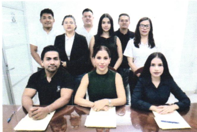
Entrega Recepción del puesto de Secretaría de Estudio y Cuenta

En esa tesitura en el periodo que se informa, se llevaron a cabo dos procesos de entrega recepción, el primero se realizó respecto al puesto denominado Secretaría de Estudio y Cuenta; y el segundo, respecto al puesto de Secretaría Auxiliar de Estudio y Cuenta.